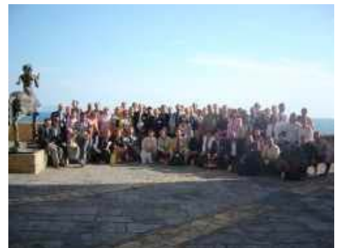
Encuentro de miembros mediterráneos de la UICN celebrado en Nápoles (Junio 2004)

Como resultado de la conferencia, los miembros aprobaron la Declaración de Nápoles, que respalda el trabajo desarrollado por el Centro en estos tres primeros años y el Programa Cuadrienal de la UICN del periodo 2005-2008 para la región del Mediterráneo. La Declaración es un llamamiento a la cooperación y estudia posibles colaboraciones con el Centro de Cooperación del Mediterráneo de la UICN, y otros miembros e instituciones regionales; intercambios de conocimientos y experiencias en la gestión de recursos naturales y la conservación de la diversidad biológica; e insta a todos los países del Mediterráneo y a la UICN a coordinar sus acciones en vistas a fomentar planes estratégicos específicos para la conservación de los principales sistemas medioambientales del Mediterráneo como son las áreas montañosas, las grandes cuencas fluviales, áreas marinas y costeras, islas y alta mar.