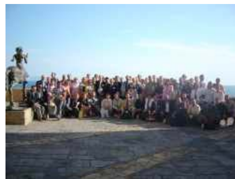
Réunion de membres méditerranéens de l'UICN tenue à Naples (June 2004)

Suite à la conférence, les membres ont agréé la Déclaration de Naples, qui soutient le travail développé par le Centre pendant ces trois premières années et le Programme intersessionnel de l'UICN de la période 2005-2008 pour la région de la Méditerranée. La Déclaration appelle aussi à obtenir de plus grandes collaborations et cherche des possibles associations avec le Centre de Coopération pour la Méditerranée de l'UICN, et d'autres membres et institutions régionales; mais aussi à échanger des connaissances et des expériences sur la gestion des ressources naturelles et la conservation de la diversité biologique; et à inciter tous les pays de la Méditerranée et de l'UICN pour coordonner ses actions en vue de favoriser des plans stratégiques spécifiques pour la conservation des principaux systèmes environnementaux de la Méditerranée comme les zones montagneuses, les principaux bassins versants, les zones marines et côtières, les îles et la haute mer.