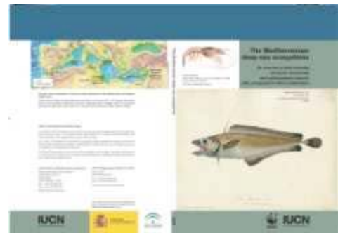
Les écosystèmes profonds de la Méditerranée: un bien précieux à sauvegarder - (PDF)

Les canyons sous-marins, les suintements froids, les lacs de saumure, les récifs coralliens d'eau froide ou les monts sous-marins sont certains des secrets cachés dans les fonds marins de la Méditerranée. Ces écosystèmes de fond marin sont très vulnérables à l'exploitation commerciale étant donné les bas taux de repeuplement propres des espèces adaptées à ce milieu, et à la faible capacité dont ils font preuve pour faire face aux fortes perturbations externes. La 7ème Conférence des Parties de la Convention sur la Diversité Biologique (Kuala Lumpur, 2004) invite les États à renforcer leur implication dans la conservation et l'utilisation durable des ressources génétiques du fond marin de haute mer au-delà des limites de la juridiction nationale. En juin on a organisé à Barcelone une table ronde sur le niveau de connaissance et de conservation de l'écosystème de la haute mer méditerranéenne au sein de la Commission Internationale pour l'Exploration Scientifique de la Mer Méditerranée (CIESM), dont le résultat a été la publication, par initiative conjointe du Programme de la Méditerranée de la WWF et du Centre de Coopération pour la Méditerranée de l'UICN, d'une proposition pour assurer la préservation à long terme des écosystèmes de la haute mer méditerranéenne, basés sur la solide information scientifique disponible actuellement.